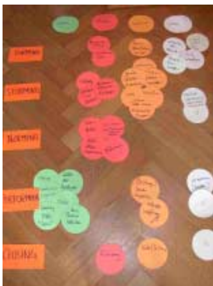
Nebstehend ein Bild aus einer vergleichbaren Situation: Eine grüne, rote, orange und weisse Gruppe sammelte Interventionsmöglichkeiten in verschiedenen Gruppenphasen.

Dieses Vorgehen ergibt ein optisch aufschlussreiches Bild, mit welchem Erfahrungshintergrund welche Einflussfaktoren im Vordergrund stehen, ohne dass jemand den Eindruck haben muss, sein Blickwinkel sei falsch oder man habe etwas vergessen. Es ist nachvollziehbar, dass man nicht immer an alles denken kann.